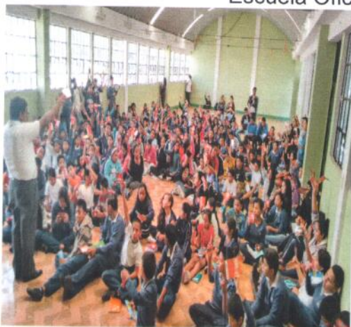
San José Pinula, Guatemala Escuela Oficial Urbana Mixta 1712